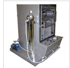
Système de filtration autonettoyant pour l'élimination de la poussière et de la boue