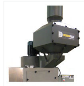
Ensemble d'après-filtre HEPA à haute efficacité