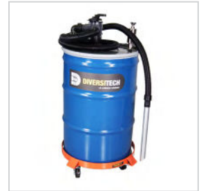
Aspirateur WV-55 pour l'évacuation de la boue