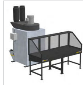
Table aspirante avec conduits offerte en quatre formats standards